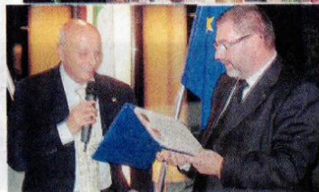
LE AUTORITÀ ROTARIANE A lato la consegna della Paul Harris