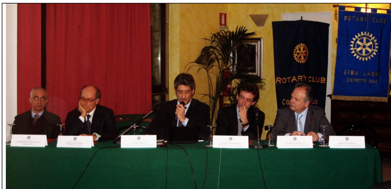
Il panel di esperti che hanno riferito sul tema del dopo-terremoto in Abruzzo