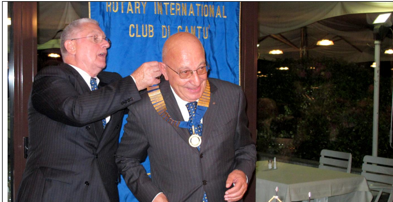
Il momento del passaggio delle consegne