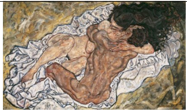
E. Schiele “L’abbraccio”, 1917

L’altro grande esponente della Secessione, Egon Schiele, molto apprezzato ed aiutato da Klimt, dipinse immagini di forte impatto emotivo che riflettevano la sua esistenza tormentata, in uno stile espressionista.