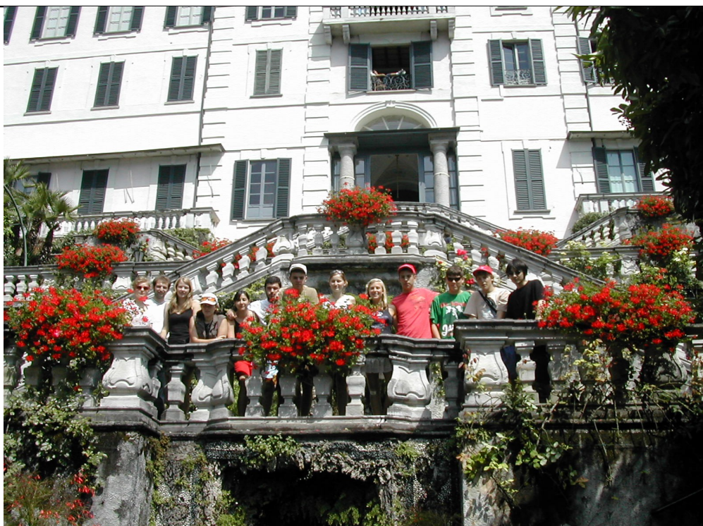
I ragazzi del Trakking Camp Lariano a Villa Carlotta

"Trakking Camp Lariano-un interclub con il RC di Appiano all' "ANCORA"