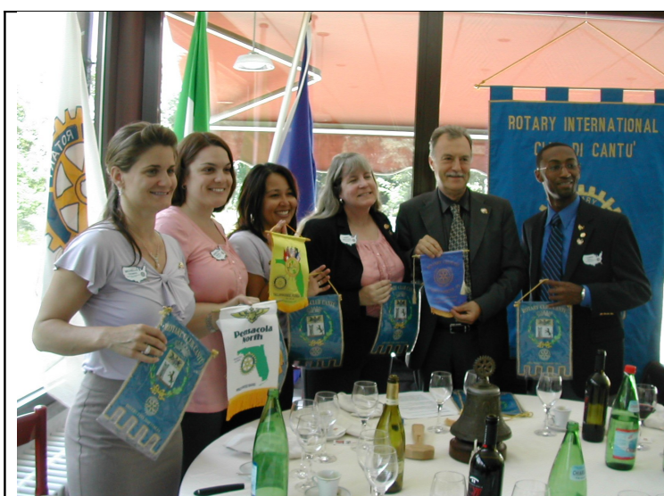
Il momento dello scambio dei gagliardetti

(Group Study Exchange) - del Distretto 6940 - Florida