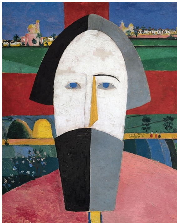
Kasimir Malevich - testa di contadino

Villa Olmo - Visita guidata alla mostra dei maestri dell'avanguardia russa CHAGALL, KANDINSKY, MALEVIC