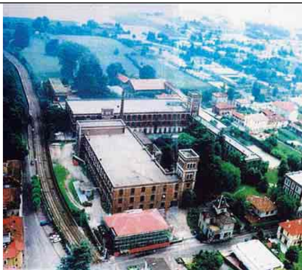
Visione aerea dell'ex Cottonificio Somaini, destinato ad ospitare il nuovo Polo tecnologico di Lomazzo

Il rilancio dell'industria comasca con il supporto di un centro di sviluppo tecnologico all'insegna della difesa dell'ambiente.